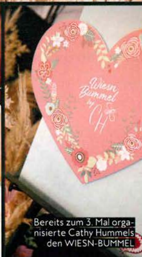
Bereits zum 3. Mal organisierte Cathy Hummels den WIESN-BUMMEL