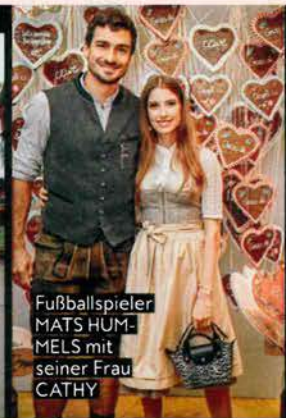
Fußballspieler MATS HUMMELS mit seiner Frau CATHY