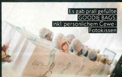
Es gab prall gefüllte GOODIE BAGS, inkl. persönlichem Cewe-Fotokissen