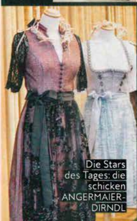
Die Stars des Tages: die schicken ANGERMAIER-DIRNDL