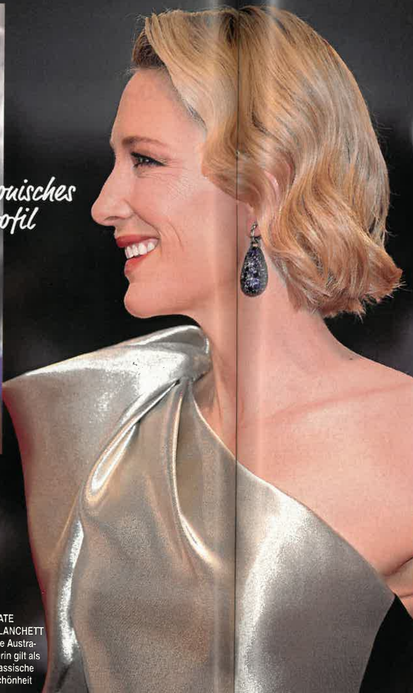
CATE BLANCHETT Die Australierin gilt als klassische Schönheit