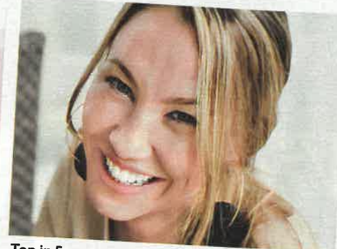
Top in Form wie Sandy: In CLOSER verrät die fünffache Mama und Markenbotschafterin der „Regulatpro“-Beauty-Drinks ihre Tricks.

Jolu Ganz natürlich: „Shampoo Bar Zitrone-Orange“, ca. 9 €.