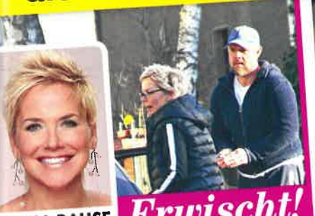
INKA BAUSE Erwischt!