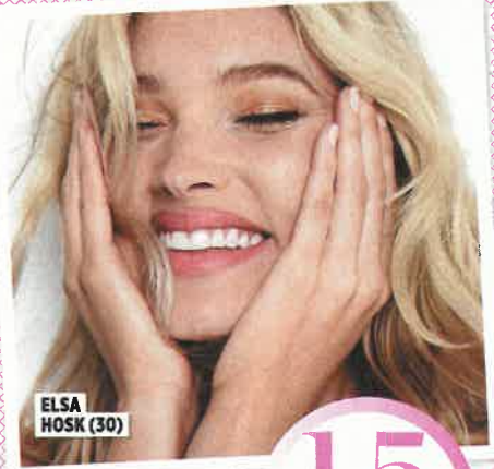
ELSA HOSK (30)

PAYOT Glättendes Öl-Serum mit Grüntee-Extrakt: „Herboriste Détox Concentré Anti-Capitons“, ca. 36 Euro.