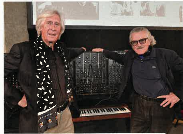
MÜNCHEN Der Moog Synthesizer Modular 3P war einer der ersten Synthesizer. Jetzt überreichte Komponist und Musikpionier Eberhard Schoener (l.) seine legendäre Anlage, die mit ihm Musikgeschichte schrieb, dem Deutschen Museum. Bei der Übergabe dabei: Yello-Frontmann (und Gastronom) Dieter Meier, der auf seinen großzügigen Freund eine Rede hielt