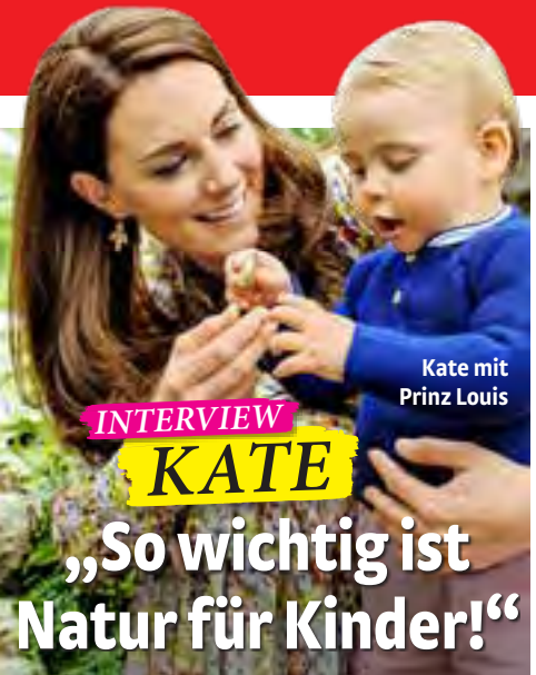
Kate mit Prinz Louis