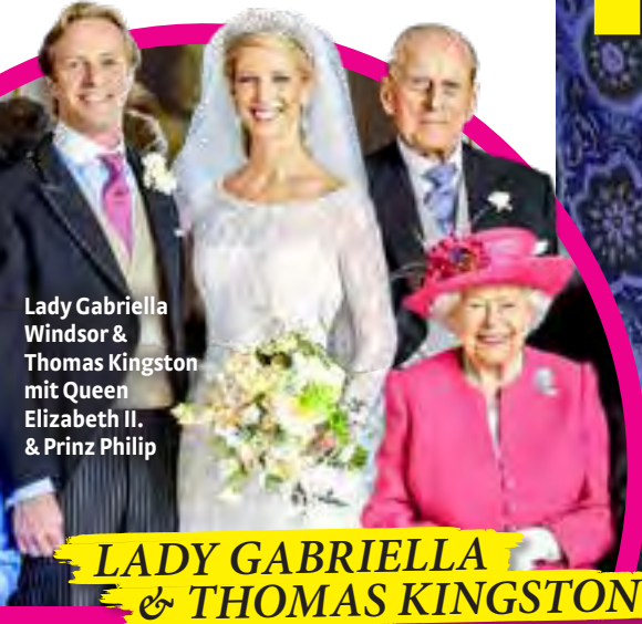
Lady Gabriella Windsor & Thomas Kingston mit Queen Elizabeth II. & Prinz Philip