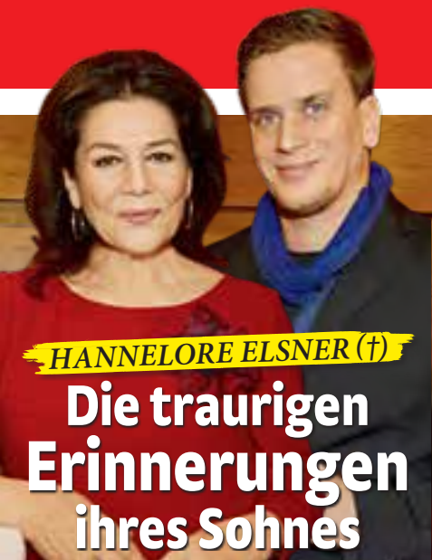
HANNELORE ELSNER (†)